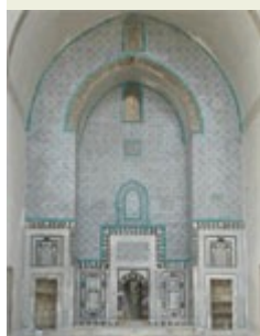
Maison Aleppine (détail)

Les premiers savons durs ont été élaborés au nord-ouest de l'actuelle Syrie vers le VIII e siècle. Ces savons, tels qu'ils existent