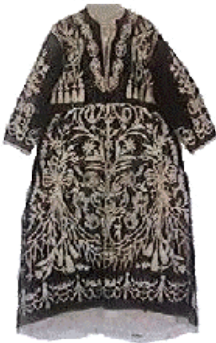
Caftan de mariage juif en soie et brodé de fil d'or. Tétouan, fin XVII siècle.

Somptueux caftan marocain! A travers lui, c'est un rêve de femme qui se dessine à même les courbes des broderies dorées et les soieries aux teintes chatoyantes, faisant scintiller l'or. A sa gloire, voilà des siècles que les bateaux des commerçants sillonnent les océans pour transporter soieries et fines étoffes depuis l'Extrême-Orient jusqu'en notre Méditerranée. Or, argent, soie, sentiment de richesse, désir de femme! Caftan! Quelle formidable industrie a-t-il fait naître! Fabricants de brocarts, ateliers de couturiers, tresseurs de fils dorés... tous s'activent et s'activeront encore à sa gloire. Et combien de femmes, en leur médina, ont usé pour lui leurs yeux sur les tambours de broderies. Combien d'enfants, apprentis artisans, ont frotté sur leurs frêles cuisses le fuseau servant à gonfler le fil, pour qu'ensuite, vienne le maître couturier le transformer délicatement en des figures chaque fois renouvelées tout le long de ses contours et extrémités! Admirer ces œuvres anciennes et belles est une invitation à la découverte. Un voyage dans le temps et l'espace.