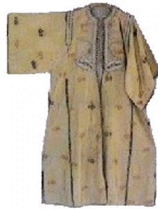
Caftan en fenzine jaune tissé en soie et en fil d'or. Tétouan, XVIII siècle.