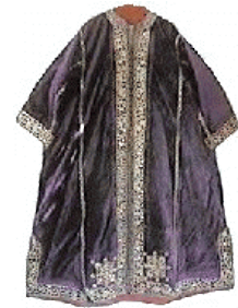
Caftan de mariage en velours de soie brodé de fil d'or. Rabat, XVIII siècle.

Qu'auraient été ces magnifiques caftans patiemment brodés des mois durant sans l'indispensable "hzame", ceignant la taille des femmes pour harmoniser davantage encore le déroulé du tissu, des hanches jusqu'aux pieds. Lorsqu'elles sont d'or ou d'argent, finement ciselées et rehaussant d'éclat les tenues de fêtes, elles sont la fierté de celles qui les portent. Et lorsqu'elles sont simplement tissées de soie ou de fil d'or, elles sont l'orgueil des passementiers qui y mettent avec zèle leur ancestral savoir-faire. La ceinture tout un symbole auquel on apportait jadis encore plus de soin dans la technique et les décors, tant son importance aux yeux des élégantes était grande. Deux siècles nous séparent de cet art oublié, sacrifié sur l'autel de la modernité, tant sont autres les "m'demates" en "skalli" ou en "hrir" actuelles.