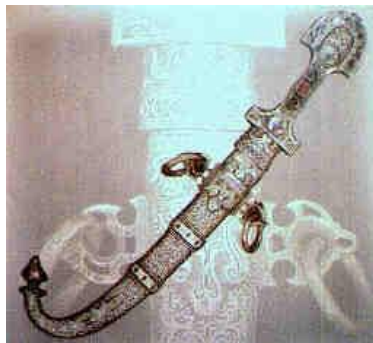
Poignard en argent niellé et émaillé. Région d'Idaouchamlal, Souss, XIX siècle.

Passé sur l'épaule droite au dessus de la jellaba, fixé par une cordelière de soie monochrome de couleur vive, de manière à retomber sur le flanc gauche, le poignard a de tout temps fait la fierté des hommes. Arme de défense avant tout, son second rôle d'apparat en a fait le bijou masculin par excellence. Il en est des multitudes sortes. C'est que, dès la puberté, les jeunes garçons les recevaient en cadeau et pouvaient, à l'âge mûr, choisir eux-mêmes un modèle à leur goûts et le faire personnaliser par l'orfèvre, y graver leur nom et l'emblème de leur tribu.