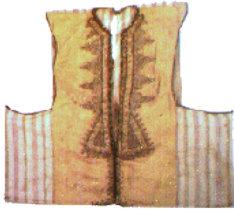
Gilet homme jaune brodé de fil d'or. Chaouen, XVIII siècle.

Moins visible, mais tout aussi flamboyant que celui des femmes, le costume masculin, se compose de deux pièces principales: le large "seroual" sans doute emprunté aux turcs et le gilet en forme de T à l'envers, où les broderies s'épanouissent avec bonheur.