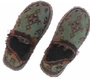
Babouches Berbères, brodés en soie et fil d'or. Région Taroudante, XIX siècle

Au loin, les cavaliers dressés sur leurs superbes chevaux ne semblaient guère attacher d'importance au costume, simplement vêtus de longues jellabas blanches et bien moins lotis que leur montures, rehaussées d'accessoires métalliques et harnachées de soie et de broderies d'or. Mirage! Dans le feu de l'action, au rythme trépidant de la fantasia, violente chevauchée faisant frémir la terre sous les sabots des bêtes, les burnous blancs tout à coup envolés ont dévoilé les costumes de dessous, rouges, verts, oranges, aussi éclatants qu'une parure de femme. De toutes les fêtes, toutes les manifestations en plein air, moussem ou grand événement familial, la fantasia est là pour faire vivre le souvenir des grandes traditions guerrières. Pour rappeler le courage et la virilité des hommes.