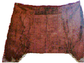
"Seroual" homme en velours de soie grenat brodé de fil d'or. Salé-Rabat, XIX siècle.