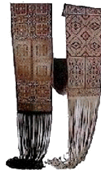
Ceinture tissée en soie et en fil d'or. La plus longue ceinture au monde (12 mètres), commandée à Fès par le père de quatre jeunes filles qui ne se sont jamais mariées. Les quatre morceaux sont restés assemblés. Rif, XVIII siècle.

Si son origine est à Marrakech, berceau historique de la chaussure traditionnelle marocaine, c'est à Fès que le savoir-faire des artisans s'est institutionnalisé, pour en faire la capitale incontestée du "cherbil". Qu'importe! Les "chelhates" aux bouts arrondis et aux couleurs chatoyantes continueront de témoigner d'un art multiséculaire, tandis qu'à l'ouest la "belgha" fera encore et toujours figure de fleuron. Mais aucune tenue marocaine ne saurait se passer de ces fines mules sans quartier ni talon, subtil trait d'union de la simplicité et du luxe, qui donne à la démarche cette allure à la fois fière, naturelle et si féminine.