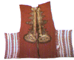
Gilet homme rouge brodé de fil d'or. Chaouen, XVIII siècle.

Passé sur l'épaule droite au dessus de la jellaba, fixé par une cordelière de soie monochrome de couleur vive, de manière à retomber sur le flanc gauche, le poignard a de tout temps fait la fierté des hommes. Arme de défense avant tout, son second rôle d'apparat en a fait le bijou masculin par excellence. Il en est des multitudes sortes. C'est que, dès la puberté, les jeunes garçons les recevaient en cadeau et pouvaient, à l'âge mûr, choisir eux-mêmes un modèle à leur goûts et le faire personnaliser par l'orfèvre, y graver leur nom et l'emblème de leur tribu.